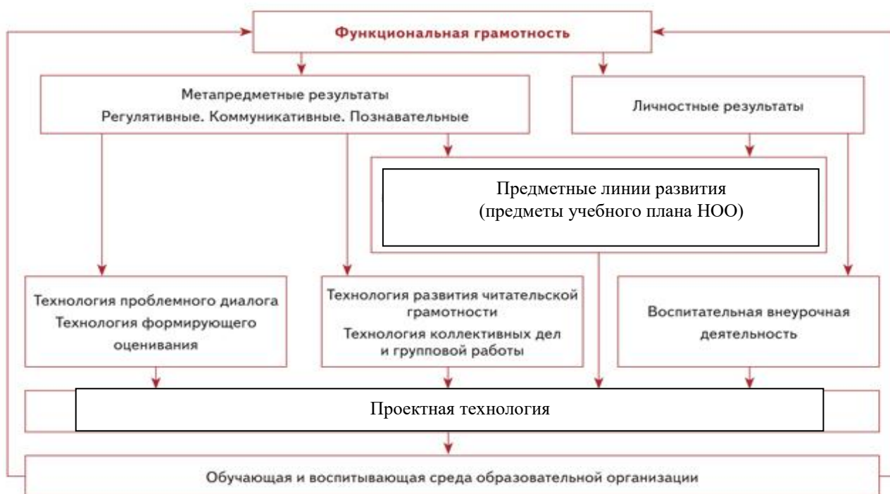
Схема «Система работы по обеспечению личностных и метапредметных результатов школьников»

Реализация цели развития младших школьников как приоритетной для первого этапа школьного образования возможна, если устанавливается связь и взаимодействие между освоением предметного содержания обучения и достижениями обучающегося в области метапредметных результатов. Это взаимодействие проявляется в следующем: